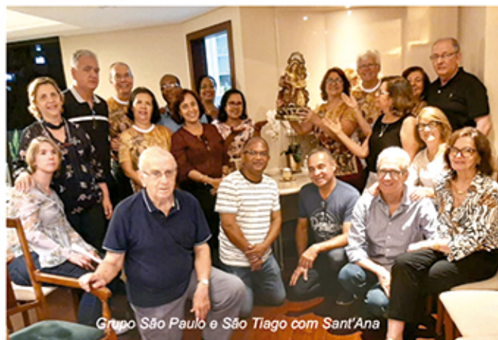
Grupo São Paulo e São Tiago com Sant'Ana