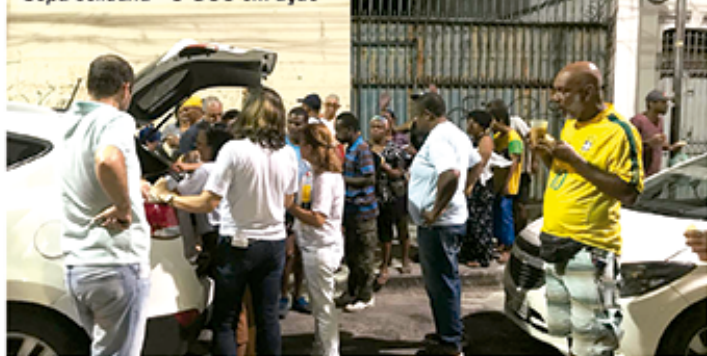
Sopa solidária - O GCC em ação