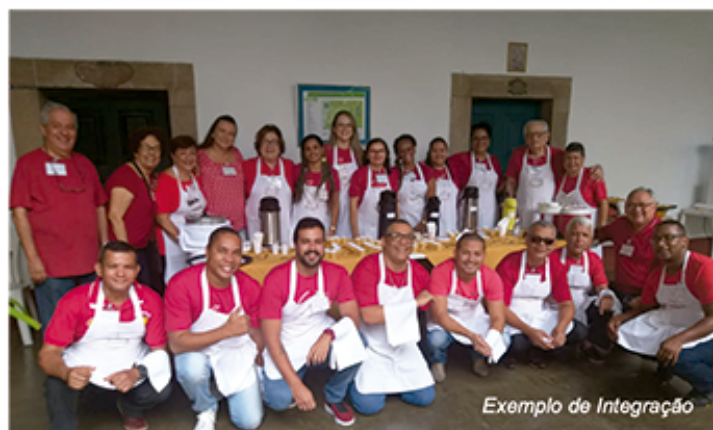
Exemplo de Integração