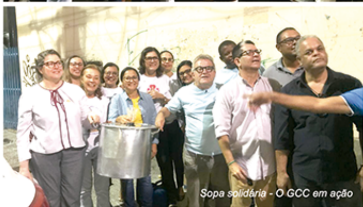
Sopa solidária - O GCC em ação