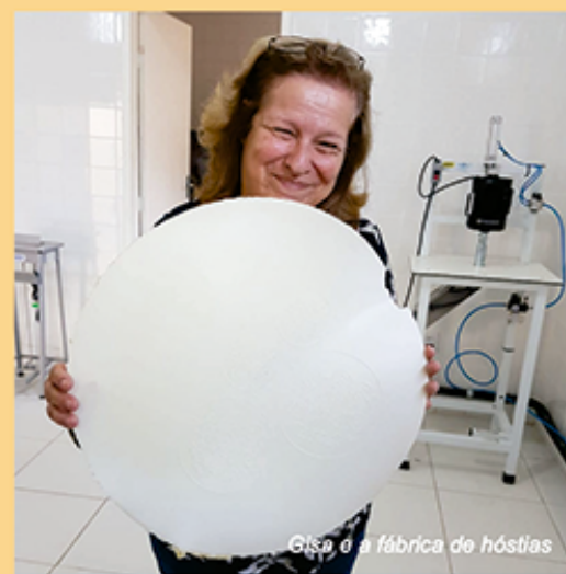
Gisa e a fábrica de hóstias