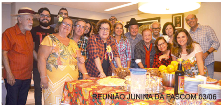
REUNIÃO JUNINA DA PASCOM 03/06